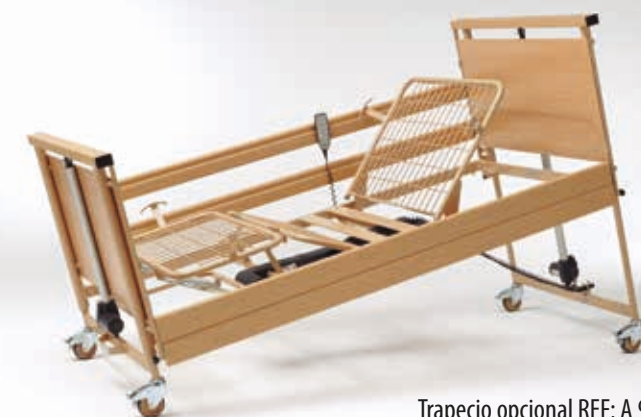
Trapezio opcional REF: A 964

Óptima para el cuidado diferenciado y libre de sujeciones