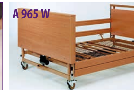
A 965 W