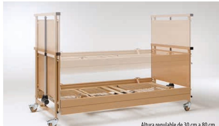
Altura regulable de 30 cm a 80 cm